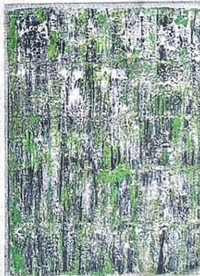
CLAUDINE PETERS-ROPSY ET LKFF GALLERY